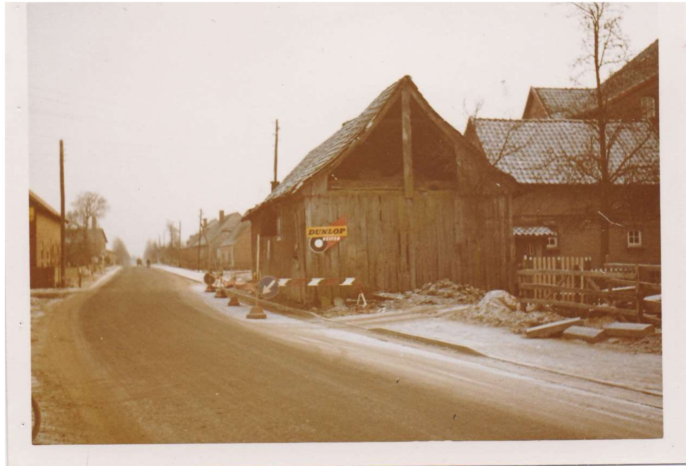
Arbeitskreis Dorfgeschichte Norddrebber

Die alte Scheune von Friedrich Garms an der Kreuzung Im Ort / Hauptstraße bei der heutigen Fußgängerampel